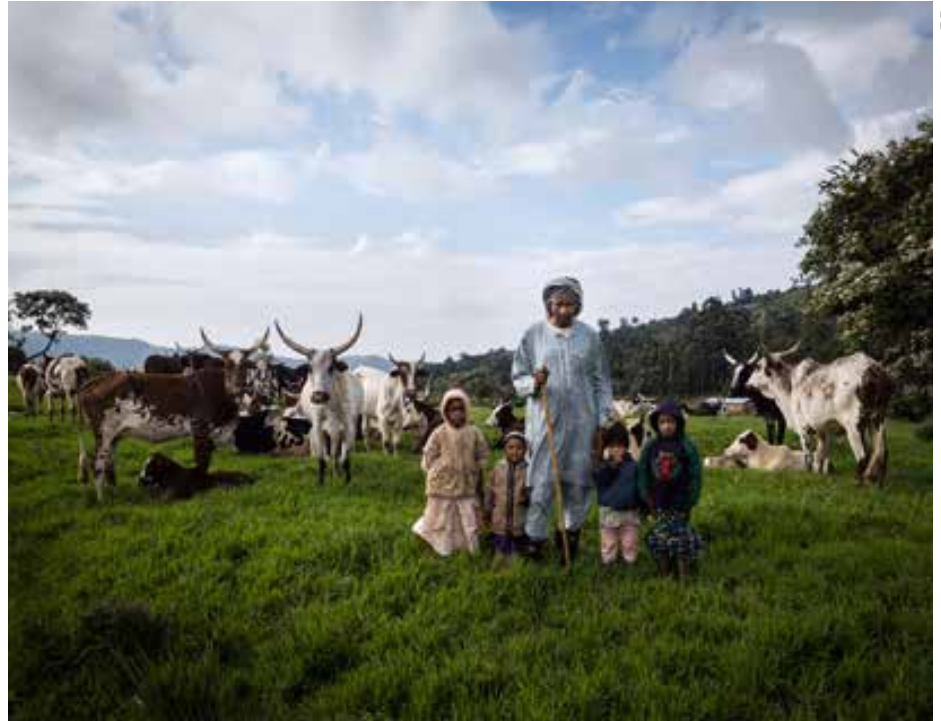
En marge du festival Ciné Regards africains, le cinéma La Pléiade projettera le documentaire Ceux qui sèment , suivi d'un débat, le 21 novembre à 20h30.

C'est devenu un rendez-vous incontournable de cette semaine : lancé à Cachan par l'association Afrique sur Bièvre, avec le soutien de la Ville, le festival Ciné Regards africains revient pour sa 8 e édi-