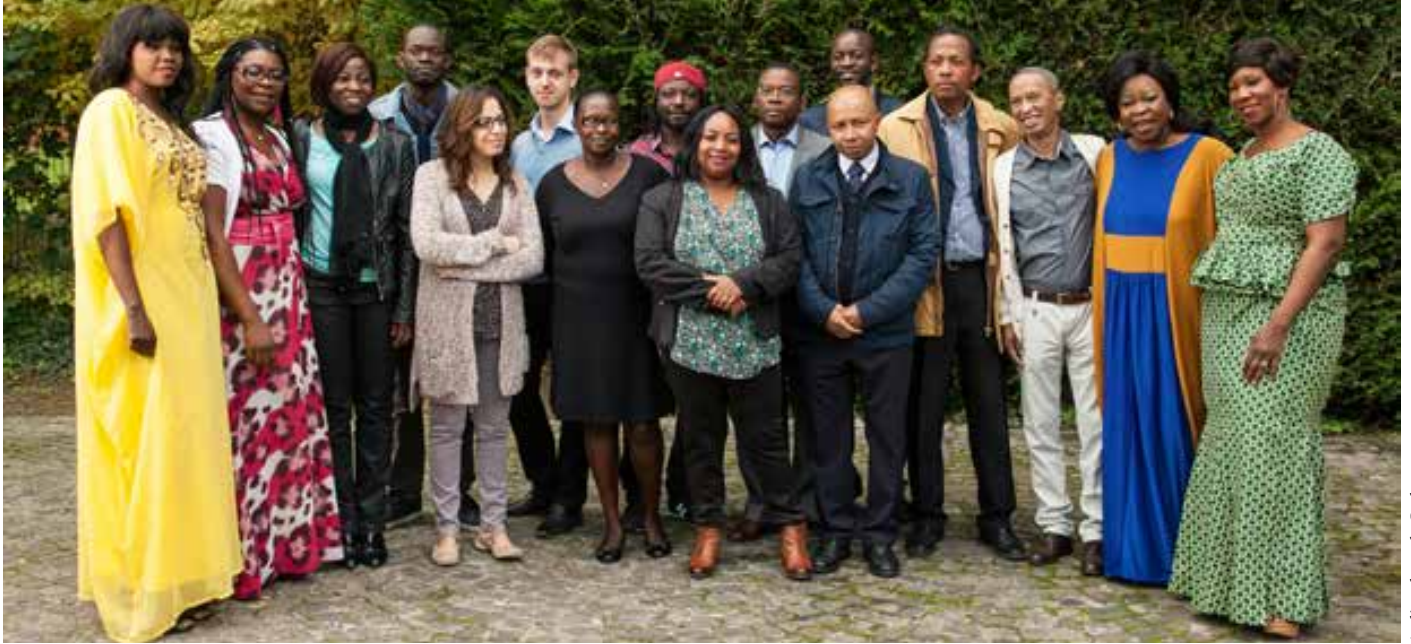
Atelier photo de Cachan