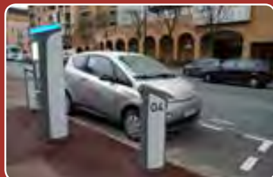
La 6 e station autolib' arrive! Page 6