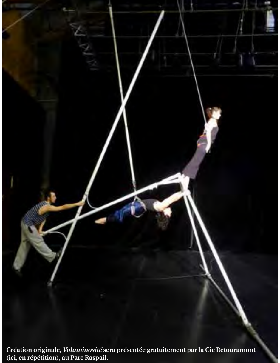
Création originale, Voluminosité sera présentée gratuitement par la Cie Retouramont (ici, en répétition), au Parc Raspail.

Dimanche dansé – dimanche 22 mars à 15h à la Roseraie Tilly, en face du château Raspail (gratuit)