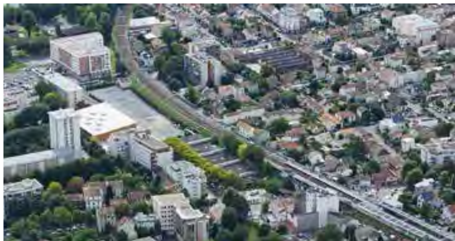
Quartier de la future gare du Grand Paris Express à Cachan