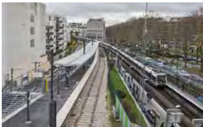
Quai n°3 de la station Denfert-Rochereau

Depuis fin décembre 2014, le quai n°3 de la gare Denfert-Rochereau est opérationnel. Ce quai permet aux voyageurs en provenance du sud d'accéder au pôle de correspondance de Denfert-Rochereau en cas de perturbations. Auparavant lorsqu'un train bloquait les circulations à l'entrée de Paris, certains RER en provenance de Saint-Rémy et de Robinson devenaient terminus à Laplace ou Cité universitaire, gares qui disposent de voies de retournement. Les voyageurs n'avaient alors d'autres solutions que d'attendre la reprise du trafic. À présent, des terminus pourront être organisés à Denfert-Rochereau, permettant aux voyageurs d'accéder à d'autres transports en cas de difficultés sur la ligne (métro, bus, vélib...). ■