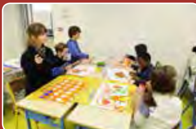
Dans les coulisses du carnaval Page 11