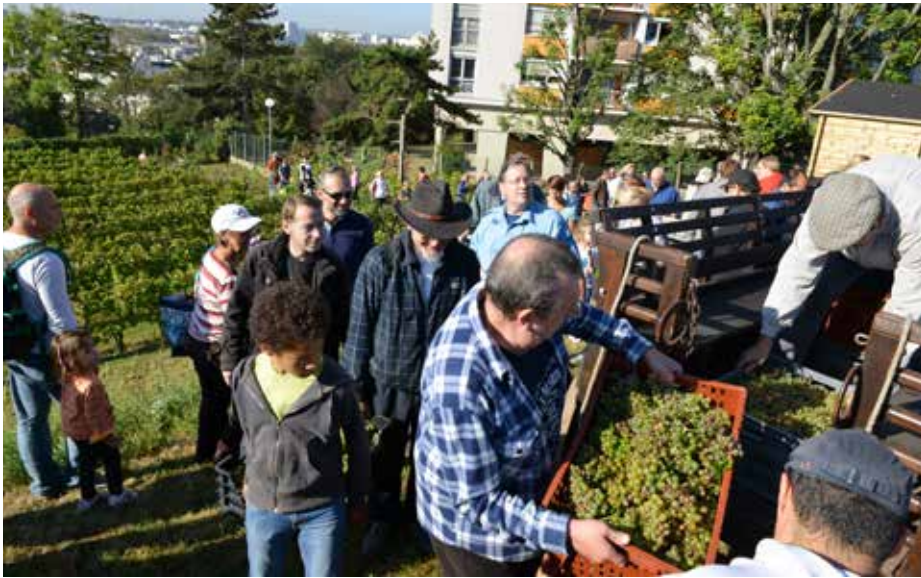
Parmi les atouts de la commune pour l'obtention du label « Ville 4 fleurs », l'implication des habitants (ici, lors des dernières vendanges) joue un rôle essentiel.

La Ville a obtenu sa première fleur, dans le cadre du Concours des villes et villages fleuris, en 2005. Volonté municipale, efforts des équipes communales et initiatives citoyennes l'ont ensuite portée vers une seconde (2007), puis une troisième fleur (2011). Aujourd'hui, une labellisation « Ville 4 fleurs » ( lire encadré ) ne renvoie plus seulement à l'entretien des espaces verts et des parterres de fleurs, mais à de nombreux enjeux, dont l'implication de l'ensemble des Cachanais. Explications.