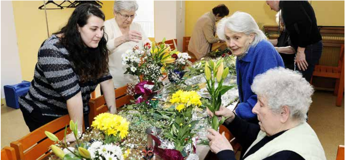
Les résidents participent à un atelier de décoration florale, organisé avec les jardiniers municipaux.

La résidence du Moulin est une structure non médicalisée, gérée par le CCAS et soutenue par la Ville et le Département. Elle accueille les retraités dès l'âge de 65 ans dans des studios non meublés, équipés d'une cuisine et d'une salle d'eau. La résidence propose par ailleurs de nombreux services : restauration, gardiennage, soins de beauté, etc.