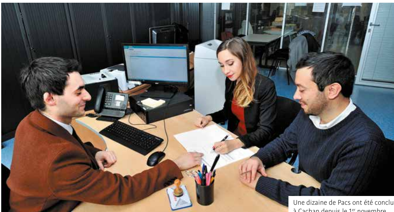
Une dizaine de Pacs ont été conclus à Cachan depuis le 1 er novembre.

+ d'info : service État civil au 01 49 69 80 30/31 et etat.civil@ville-cachan.fr