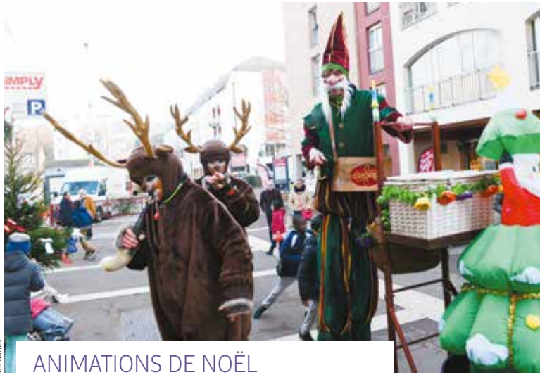
ANIMATIONS DE NOËL