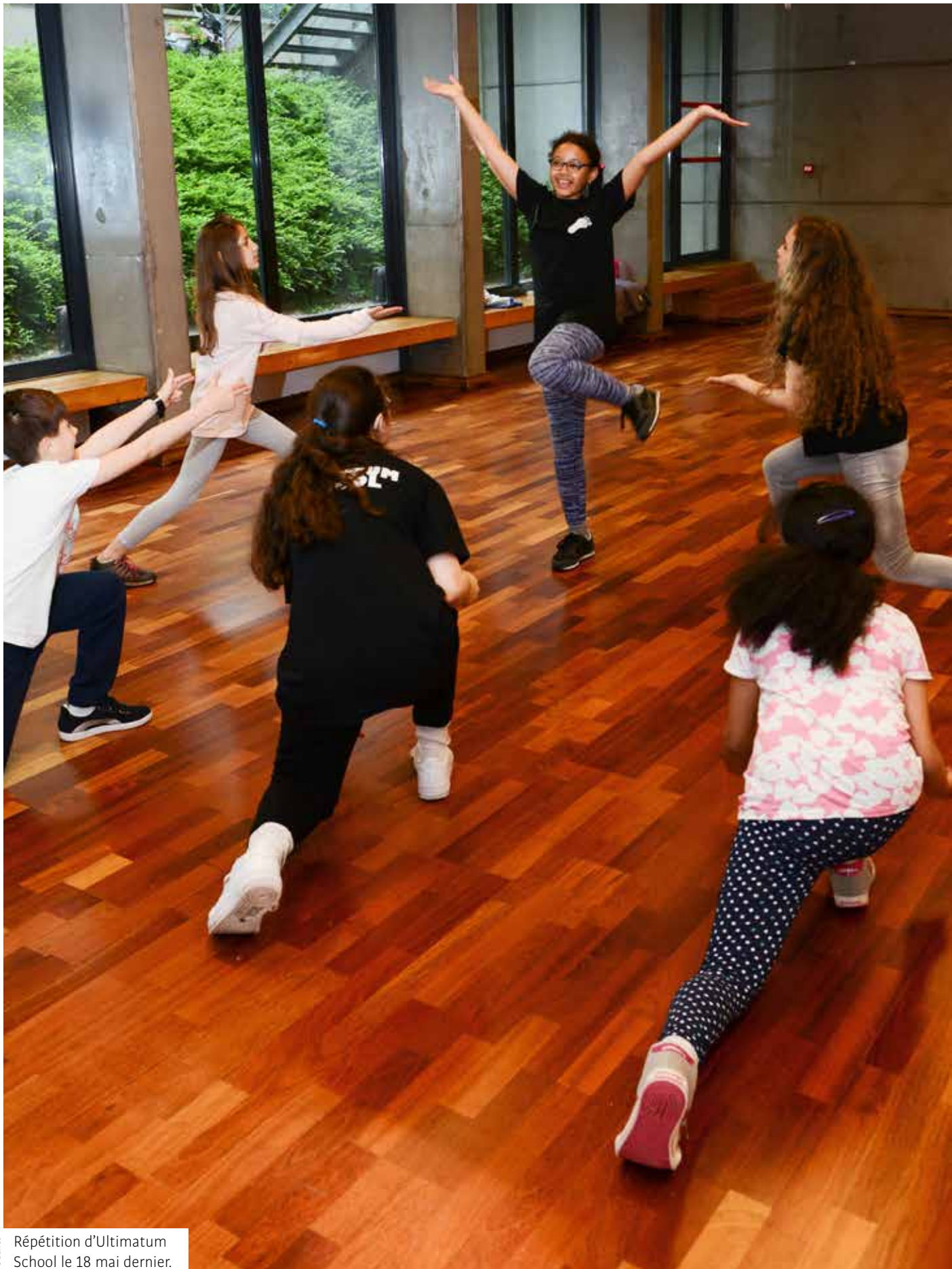
De Banes Répétition d'Ultimatum School le 18 mai dernier.