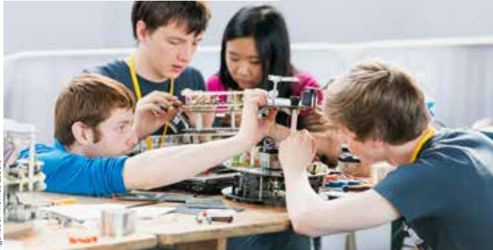
Agence JI-Thomas Labois

Les étudiants préparent leur robot pour la coupe robotique des IUT GEI