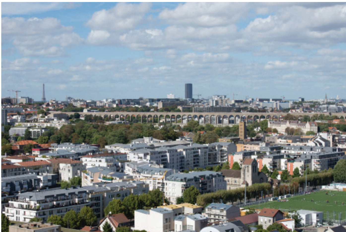
Ville de Cachan

Nichée au cœur de la Vallée Scientifique de la Bièvre, dans le département du Val de Marne et dans la dynamique métropolitaine, Cachan s'étend sur une superficie de 278 hectares. Elle compte au 1 er janvier 2014, 30 258 habitants, appelés les Cachanais.