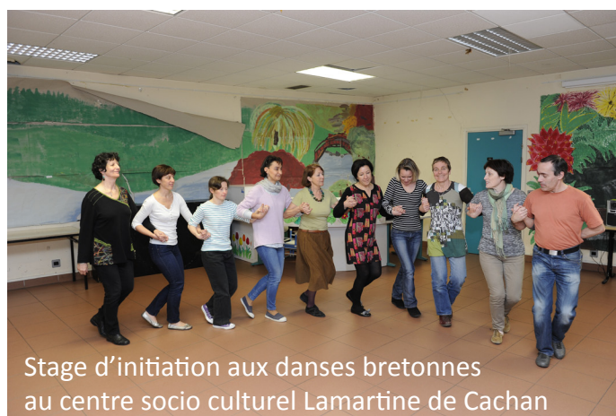
Stage d'initiation aux danses bretonnes au centre socio culturel Lamartine de Cachan

Gratuite et ouverte à tous, elle est organisée au centre socioculturel Lamartine (4 square Lamartine à Cachan) le jour du fest-noz de Cachan, samedi 10 mars de 14h30 à 17h.