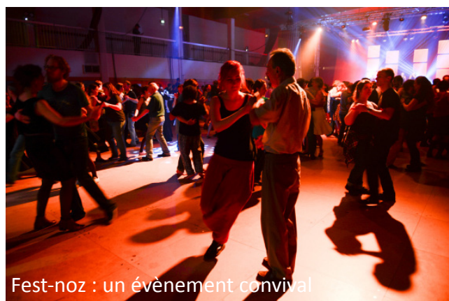
Fest-noz : un événement convivial