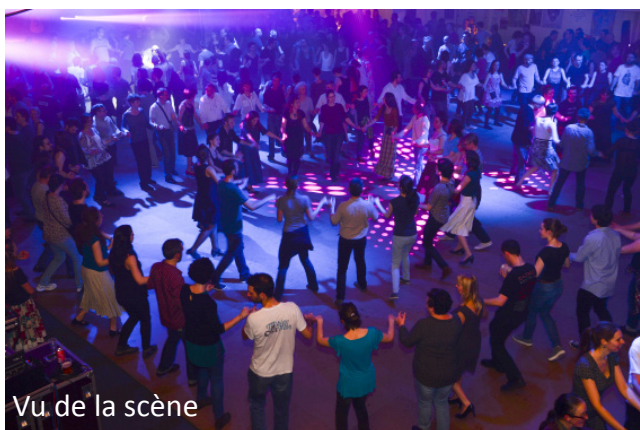
Vu de la scène