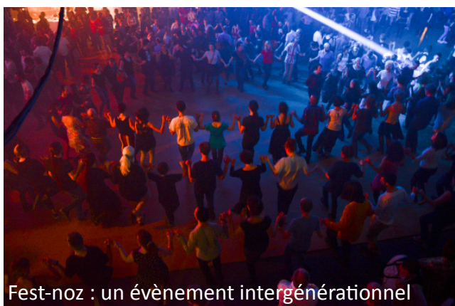
Fest-noz : un événement intergénérationnel