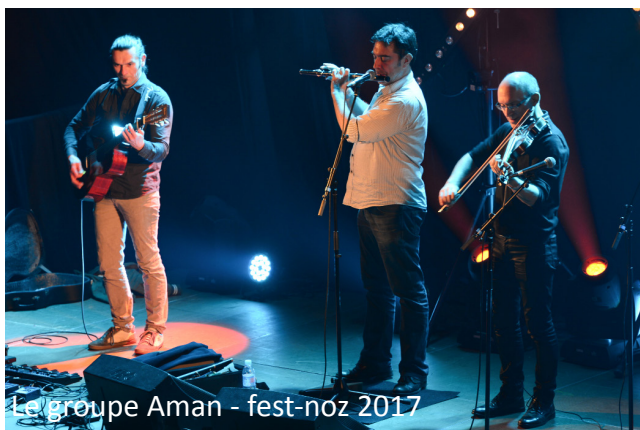
Le groupe Aman - fest-noz 2017