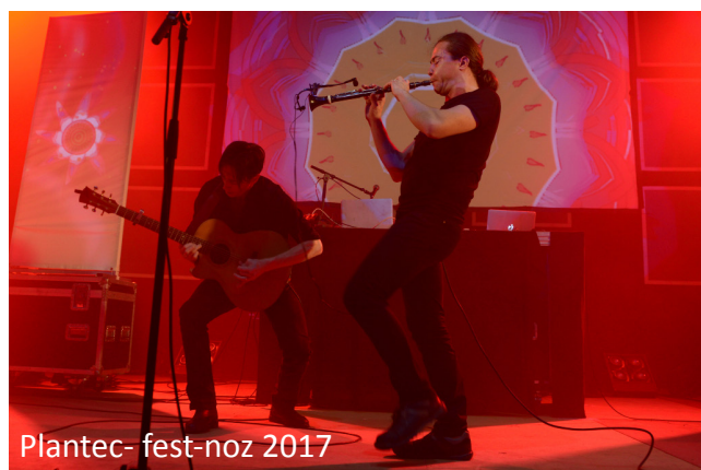
Plantec- fest-noz 2017