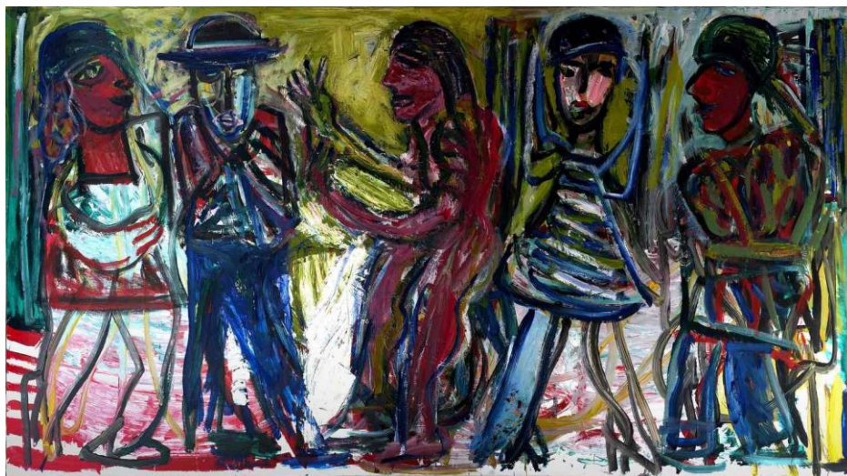
Les petits soldats, acrylique sur toile, 140 x 250 cm, 2016