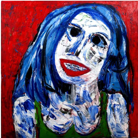
La Joyeuse Betty , acrylique et huile sur toile, 140 x 140 cm, 2016