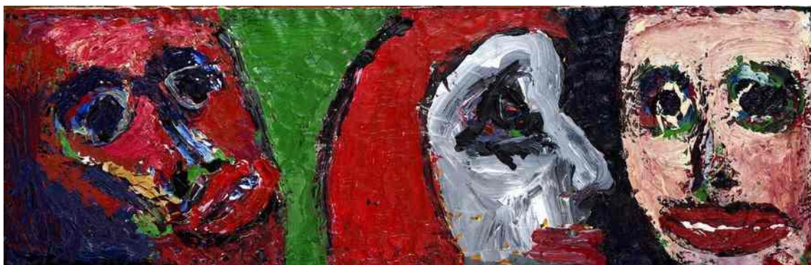
Visages – Composition II , acrylique et huile sur toile, 35 x 110 cm, 2015