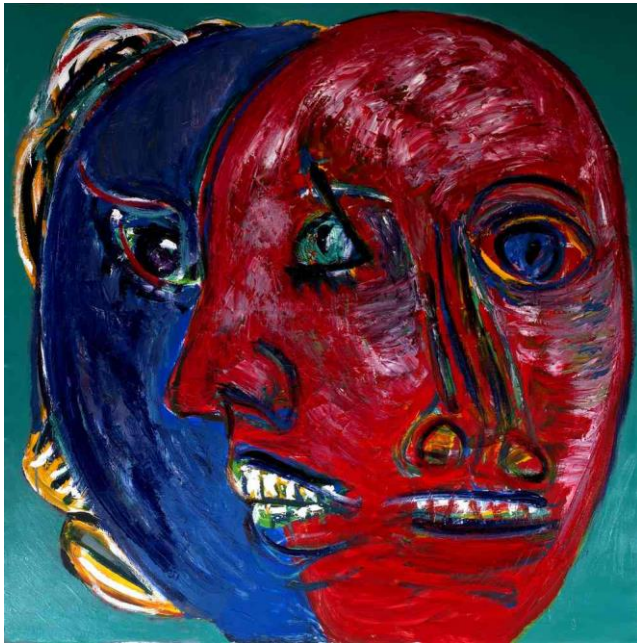
Le Dialogue , acrylique sur toile, 140 x 140 cm, 2015

Les passants sont des gens qu'on croise dans la rue, au café, dans le métro, dans les aéroports, mais qu'on ne connaît pas, qu'on ne rencontre pas. On les voit, parfois on les remarque, parfois on les observe, mais ils demeurent des inconnus, des anonymes. Pourtant ils incarnent la société dans laquelle on vit, on baigne et offrent donc une image ou plutôt un kaléidoscope de cette société.