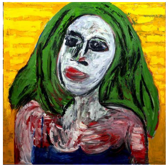
Ida aux cheveux verts , acrylique et huile sur toile, 140 x 140 cm, 2016

Cile ne peint pas des portraits mais des visages ou plutôt des faces, parfois dédoublées ou encore des profils, parfois assemblés. Il s'agit la plupart du temps de visages féminins mais il arrive même que le sexe de la personne demeure incertain. Ces visages traduisent la perte de l'individualité sinon de l'identité dans une société de plus en plus massifiée où la personnalité s'efface derrière l'apparence.