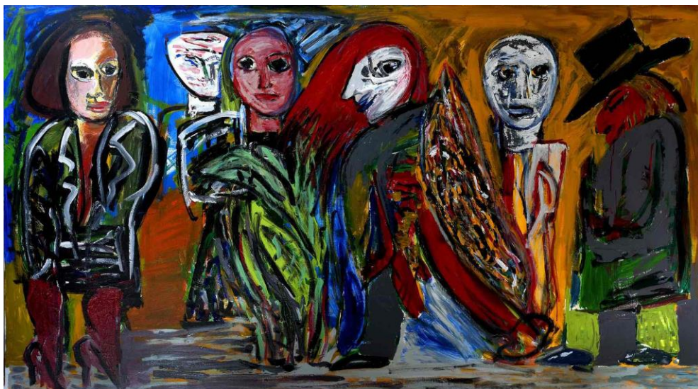
Les passants , acrylique et huile sur toile, 140 x 125 cm, 2016