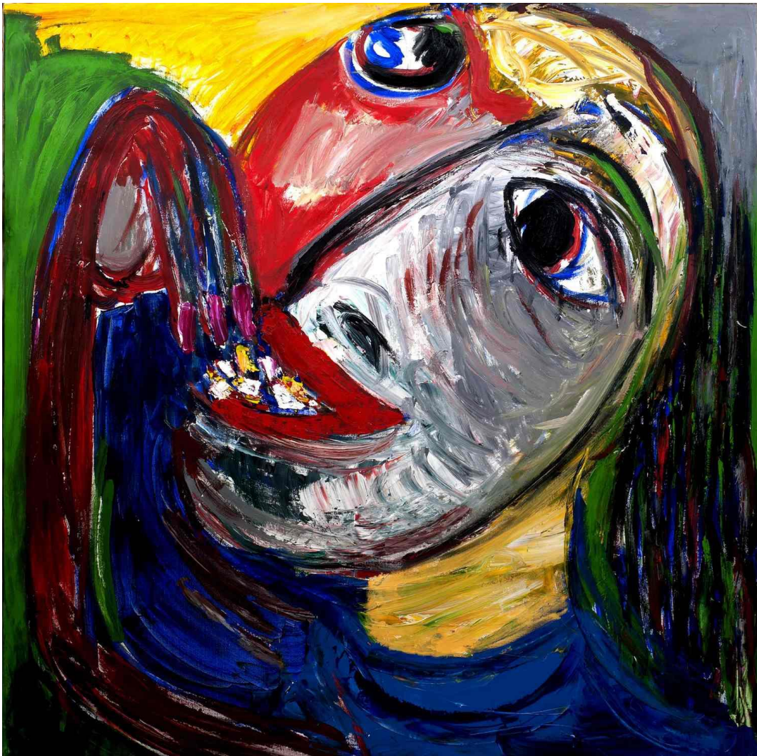
La Dévoreuse , acrylique et huile sur toile, 140 x 140 cm, 2016