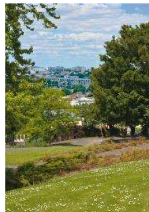
Photo du Jardin Panoramique