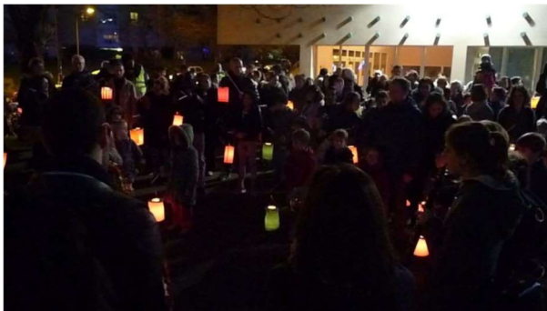
photo de la descente aux lampions et photo de l'envol des lanternes

C'est un des moments préférés des habitants de Cachan juste avant Noël.