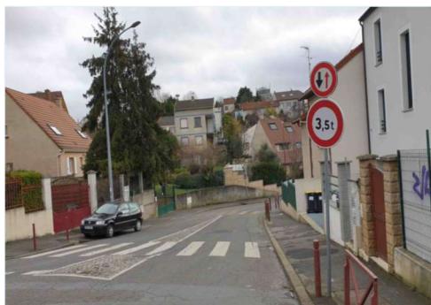
Photo du seul panneau d'interdiction aux camions dans le haut de la rue du Coteau