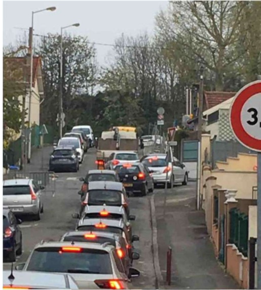
Photo d'un embouteillage rue Emile Zola